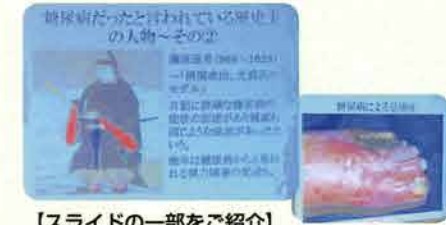
【スライドの一部をご紹介します】