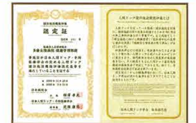
【人間ドック健診施設機能評価認定証書】